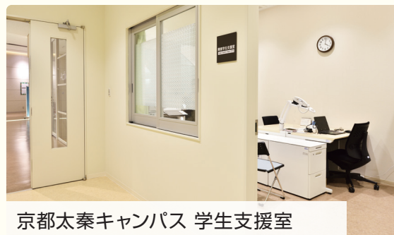
京都太秦キャンパス 学生支援室