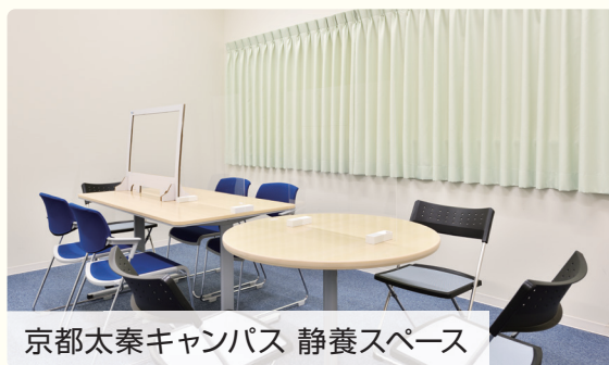
京都太秦キャンパス 静養スペース

主に講義や実習等の修学に困難を抱える学生に対し、保健室、学生相談室、関係する教職員等の各部門と連携、協議し、合理的配慮の提供にかかる支援を行っています。