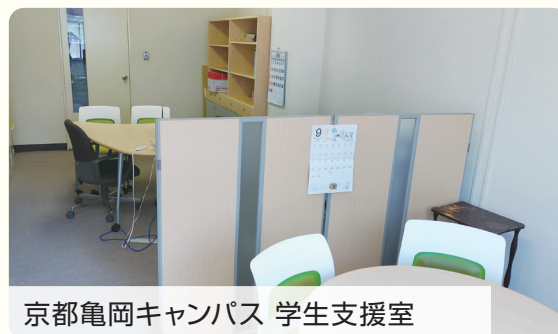
京都亀岡キャンパス 学生支援室