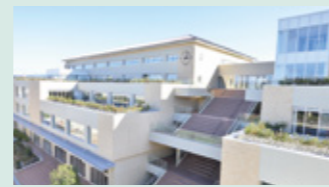
工学部棟全景。各所に開放的なテラスも設置され、豊かなコミュニケーションや発想を育みます。

校舎と隣接する学生寮には、一人ひとりの個室が設けられます。校舎内の4階には電気電子工房(通称「EWS」)が、そして1階・地下には機械工房(通称「MWS」)が設けられ、学生はいつでも課題の試作や、ロボットコンテストなどに向けた創作に没頭できます。使用する部品もほとんどを無料で、ひらめいたときにすぐ試作、失敗しても何度でも試作可能。モノづくり好きにはたまらない環境で4年間を過ごすことができます。