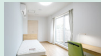
学生寮個室。一人ひとりに快適な環境が提供されます。