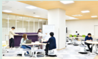
ラーニング・コモンズ。 毎日、自分が座りたい席を自由に選ぶことができます。

工学部棟には、広々としたラーニング・コモンズがあり、どこに座るかは毎日自由。つまり、進行中のグループワークや課題に応じてまとまって座ることができます。2022年9月には、留学生の2期生113名が世界33カ国から入学。国籍の違いを超えてテーブルを囲み、さまざまな課題にチームで取り組みます。