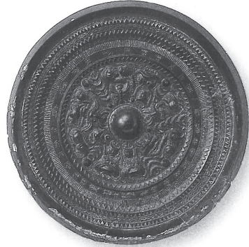
京都大学総合博物館所蔵