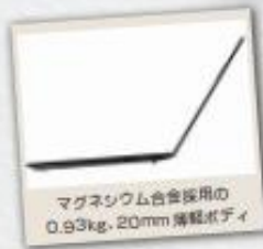
マグネシウム合金採用の 0.93kg、20mm 薄軽ボディ