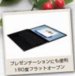
プレゼンテーションにも便利 180度フラットオープン