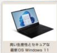
高い生産性とセキュアな 最新OS Windows 11