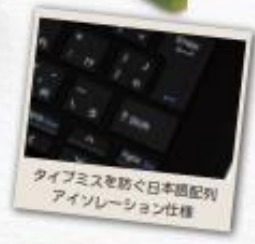
タイプミスを防ぐ日本語配列 アイソレーション仕様