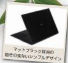
マットブラック採用の 飽きの来ないシンプルデザイン